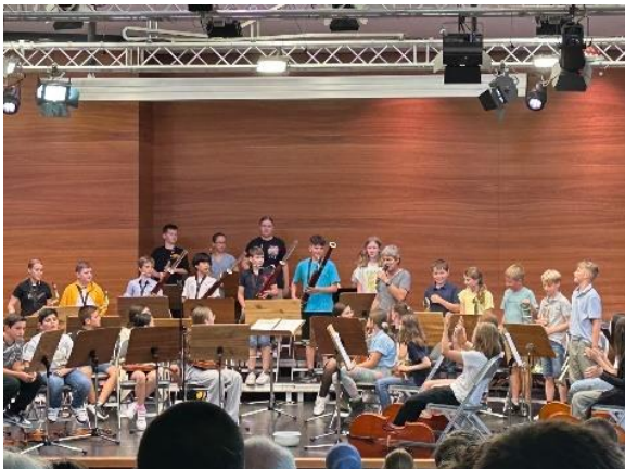
Carmen in Concert AEG Musizierklassen Bläser & Streicher Ensemble, am 10.07.2024