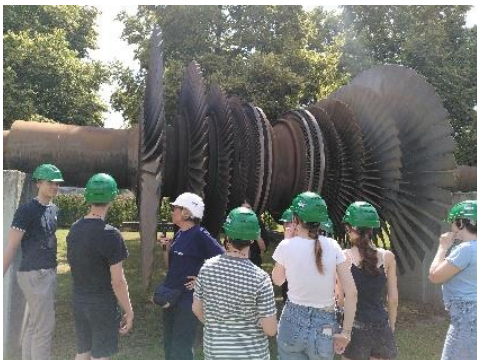
NWT – Exkursionen zum Kohlekraftwerk