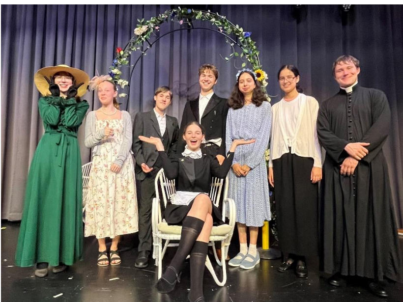
Theater Ernst sein ist alles (Drama Group) am 07.07.2024