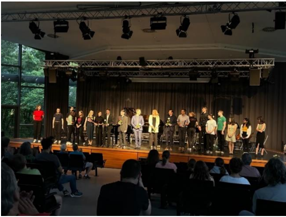
Schubertiade am AEG ‚Schule trifft Hochschule‘ Studenten der Musikhochschule Stuttgart und der Leistungskurs Musik aus der 11. Klasse des AEG, Montag, 10.06.2024