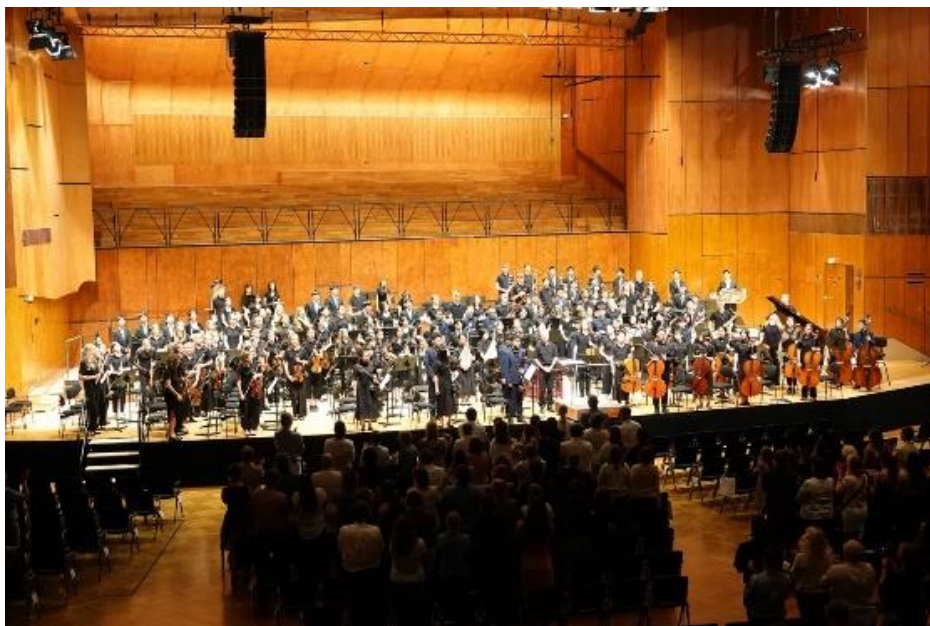
Orchesterkonzert mit den Chinesen des Li-Ka-Shing Colleges aus Hongkong, in der Liederhalle Stuttgart am 16.07.2024