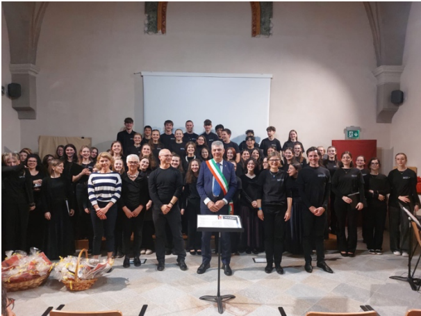
Konzert in Alba