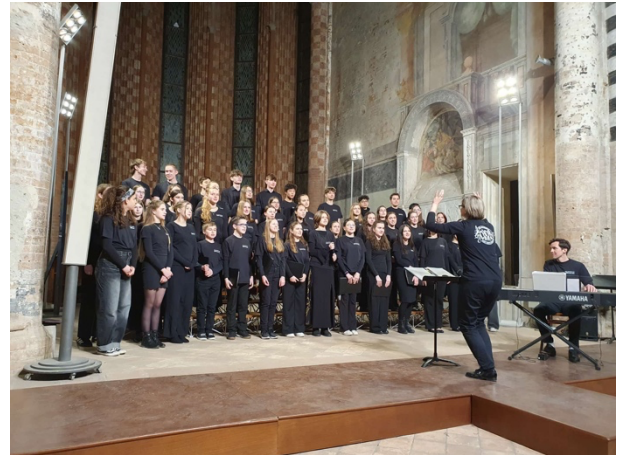
Konzert in Roddi