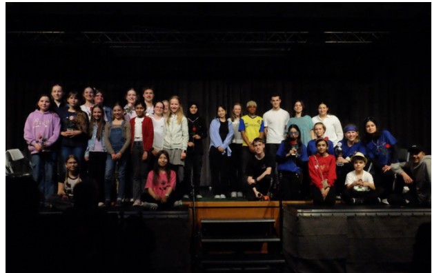
Abschlussbild aller Theatergruppen des AEG