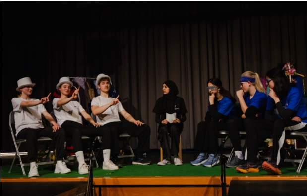
Impromatch der German Drama Group

Ende März boten die verschiedenen Theaterklassen und -gruppen des AEG ein abwechslungsreiches Programm auf der großen Aulabühne und präsentierten selbst geschriebene und inszenierte Szenen sowie ein grandioses Impromatch. Die Theaterklasse 5 eröffnete den Abend mit Szenen zum Thema Freundschaft, gefolgt von der Theaterklasse 6 , die Szenen über Familie, Kultur und Generationenkonflikte zeigte. Der Literatur- und Theaterkurs 12 präsentierte die Abschlussarbeit „Hinter den Noten“, die sich mit Themen wie Leistungsdruck, Erwartungen und Berufswünschen beschäftigte. Den Abschluss bildeten die Impromatches der German Drama Group , bei denen die Teams WEISS und BLAU in verschiedenen theatersportlichen Disziplinen um den AEG-Pokal kämpften. Unter der Regie von Frau Klett-Jung waren es zwei gelungene und inspirierende Theaterabende.